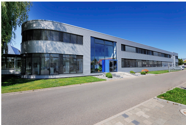
Abbildung 1: BVS Blechtechnik in Böblingen, Deutschland

Mit über 300 Mitarbeitern ist die BVS Gruppe ein Blechverarbeitungsunternehmen, das maßgeschneiderte Blechprodukte, die Montage von Komponenten, ESD-Montage und die Auftragsfertigung von Endgeräten für eine breite Palette von Branchen anbietet, darunter Elektrotechnik, erneuerbare Energien, Medizintechnik und Telekommunikation.