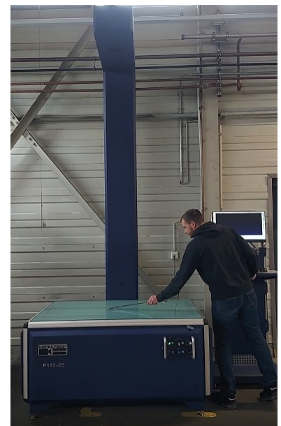
Abbildung 2: Metallteil wird auf Planarmaschine bei BVS gemessen

Seit der Installation der Planar-Maschine hat BVS eine